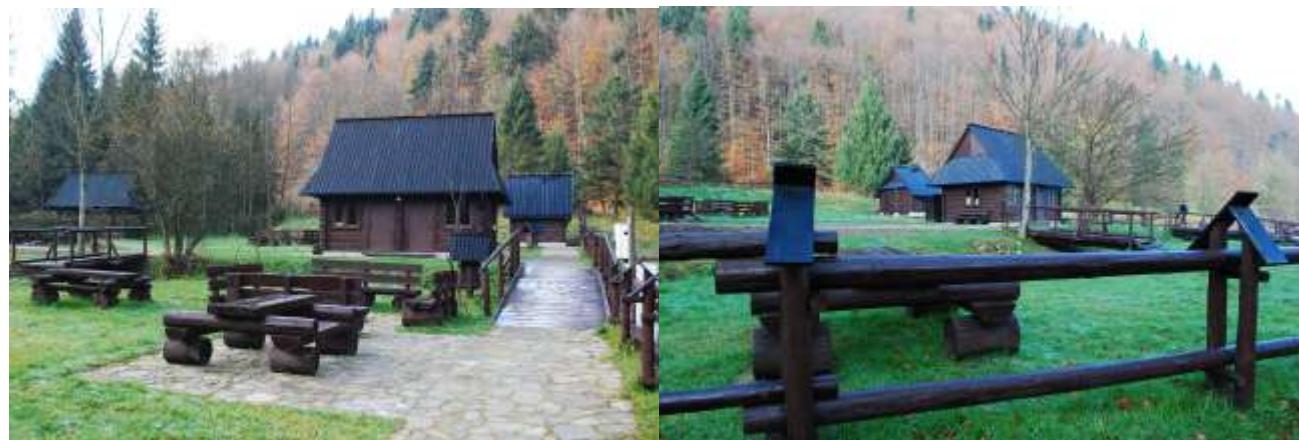
Polana Trusiówka 2014