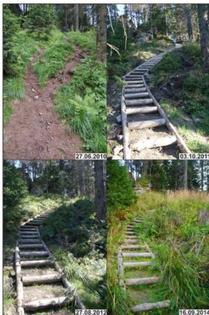
Ryc. 30. Punkt CZ4 - stan trasy w 2010, 2011, 2012 i 2014 roku. Szlak czarny

7) Przeprowadzono monitoring procesów erozyjnych i pokrycia roślinności na wybranych powierzchniach siedlisk w strefie oddziaływania ruchu turystycznego. Ocena wpływu podejmowanych działań na poprawę stanu siedlisk Ostoi Gorczańskiej stanowi podstawę do wyboru najbardziej efektywnych metod, technologii. Wyniki monitoringu pozwalają na wybór optymalnych rozwiązań technicznych na remontowanych szlakach. Obszerne sprawozdanie z monitoringu dostępne jest w bibliotece GPN.