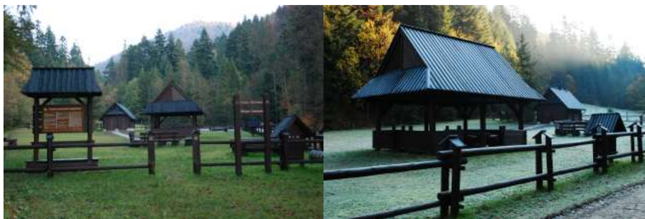
Polana Oberówka 2014

Ponadto wyposażono w niezbędny sprzęt (meble, systemy wystawiennicze) punkt informacyjno-edukacyjny na Trusiówce. Miejsce biwakowe zostało przystosowane dla osób niepełnosprawnych. Celem ochrony miejsc biwakowych objęto je całodobową obserwacją monitoringową.